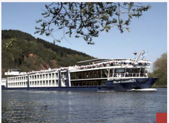
Die „Avalon Tranquility“ ist eines der modernsten Flussschiffe Europas und gehört mit 135 Metern Länge zu den Riesen auf europäischen Flüssen.